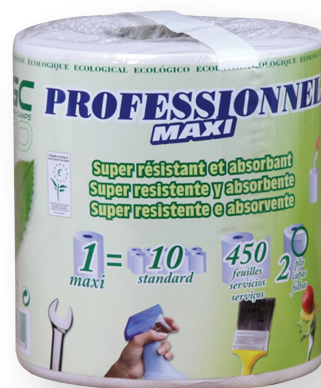
8030 PAPEL DE COCINA MULTIUSOS 2 CAPAS C/6 Rollo 106 m