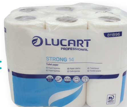
9891 PAPEL HIGIÉNICO VIRGEN DOMÉSTICO 2 CAPAS C/108 Rollo 14 m