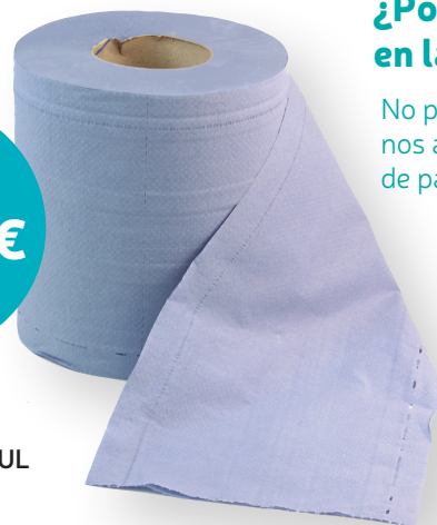
9892 SECAMANOS AZUL 2 CAPAS C/6 Rollo 143 m