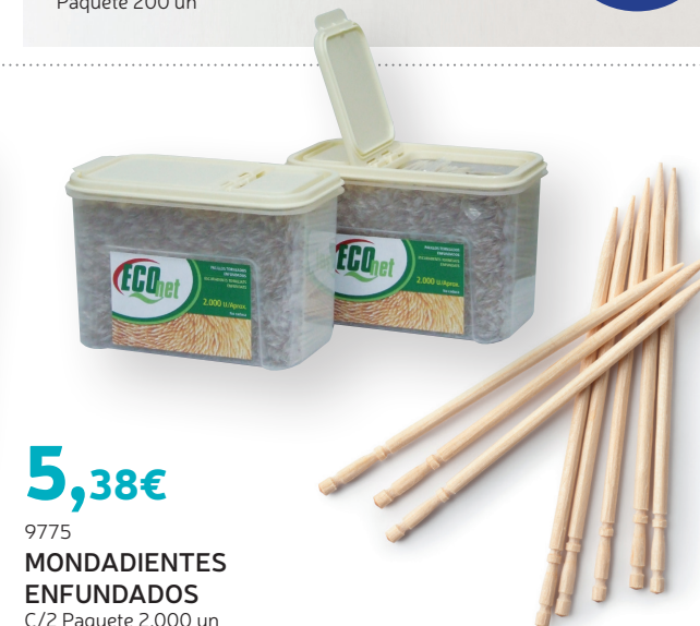
5,38€ 9775 MONDADIENTES ENFUNDADOS C/2 Paquete 2.000 un