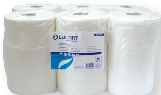
9717 PAPEL HIGIÉNICO VIRGEN INDUSTRIAL 2 CAPAS C/18 Rollo 125 m