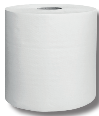
9712 SECAMANOS VIRGEN 1 CAPA C/6 Rollo 175 m